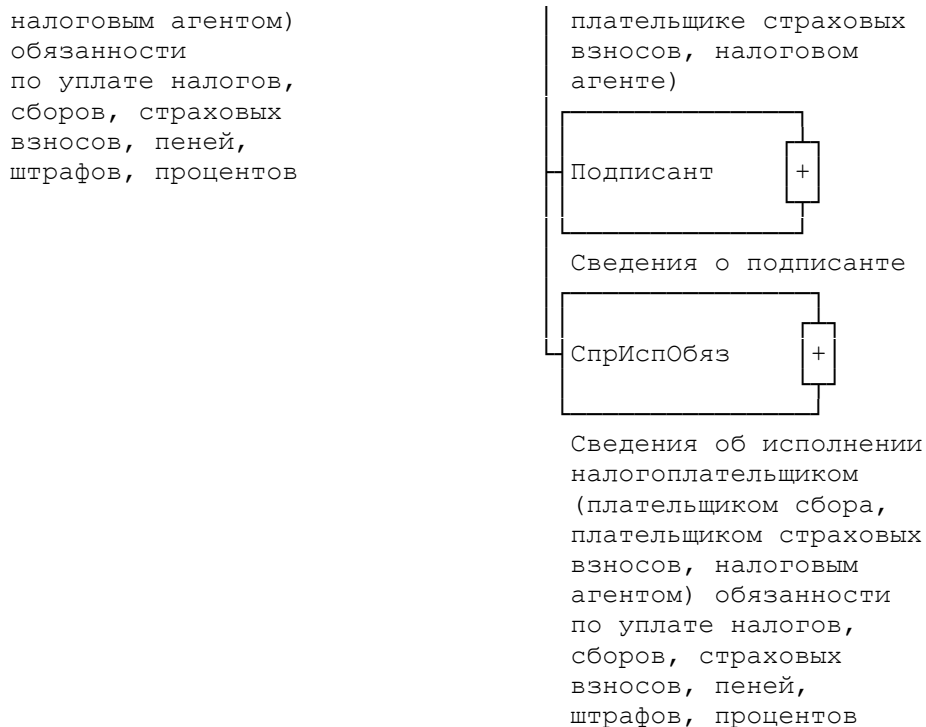
Рисунок 1. Диаграмма структуры файла обмена