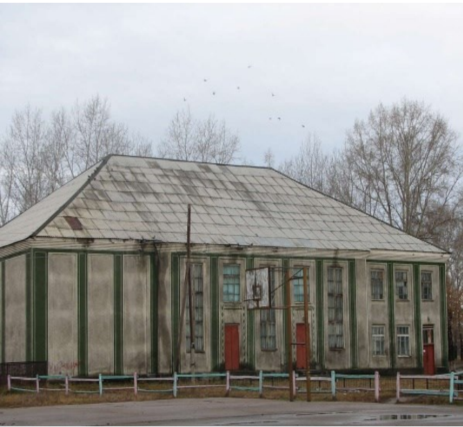
Дом культуры в с. Костин Лог Мамонтовского р-на Алтайского края